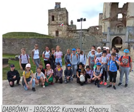
DĄBRÓWKI – 19.05.2022: Kurozwęki, Chęciny, Święty Krzyż, Krzyżtopór, Ostrowiec Świętokrzyski klasa 4