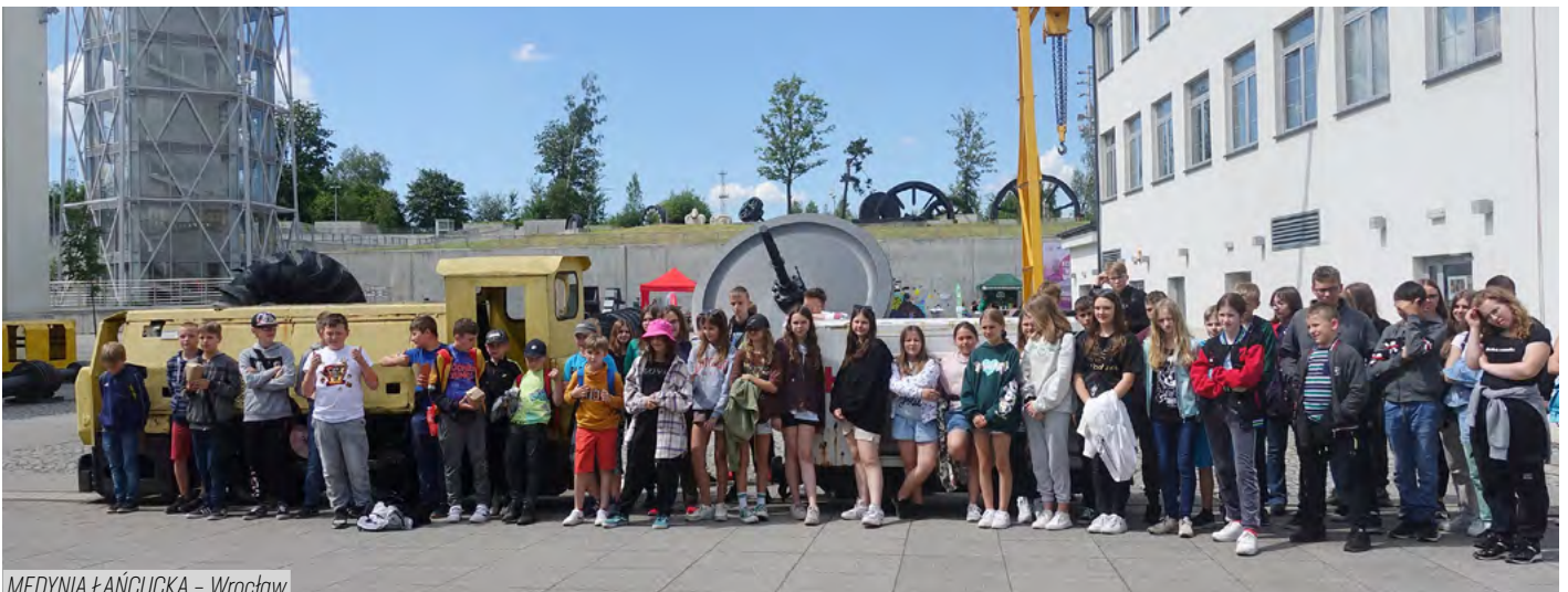
MEDYNIA ŁAŃCUCKA - Wrocław