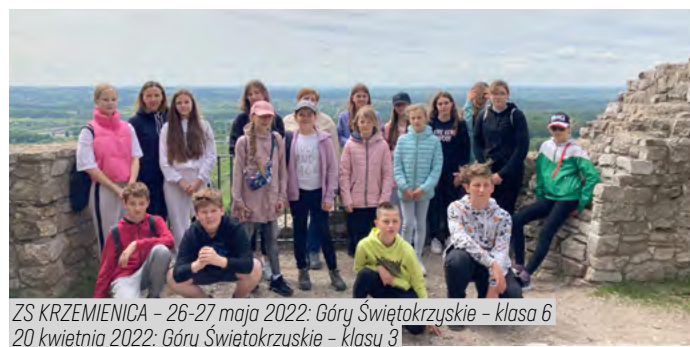
ZS KRZEMIENICA – 26-27 maja 2022: Góry Świętokrzyskie – klasa 6 20 kwietnia 2022: Góry Świętokrzyskie – klasy 3