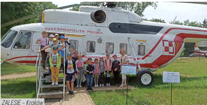
ZALESIE - Kraków