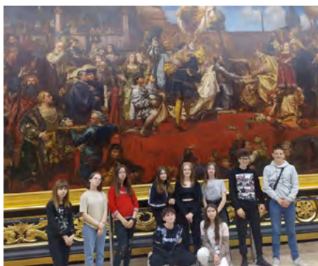
DĄBRÓWKI – 20.06.2022: Wycieczka do Krakowa