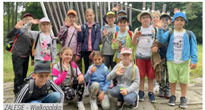
ZALESIE - Wielkopolska