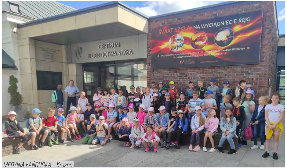
MEDYNIA ŁAŃCUCKA - Krosno