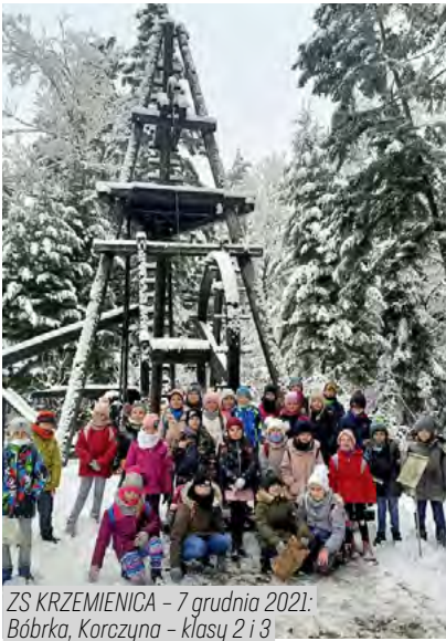
ZS KRZEMIENICA - 7 grudnia 2021: Bóbrka, Korczyzna - klasy 2 i 3