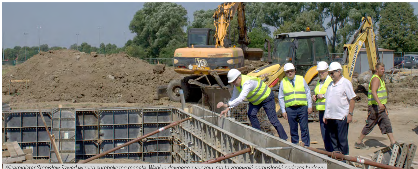
Wiceminister Stanisław Szwed wrzuca symboliczną monetę. Według dawnego zwyczaju, ma to zapewnić pomyślność podczas budowy.