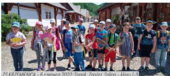
ZS KRZEMIENICA – 6 czerwca 2022: Sanok, Zagórz, Solina – klasy 1-3