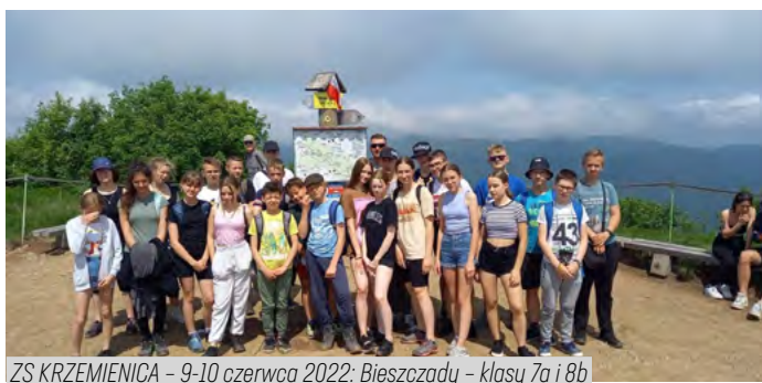
ZS KRZEMIENICA – 9-10 czerwca 2022: Bieszczady – klasy 7a i 8b