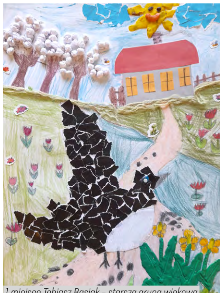
1 miejsce Tobiasz Basiak - starsza grupa wiekowa

Wszyscy uczestnicy konkursu otrzymali dyplomy oraz książki. Serdecznie gratulujemy!