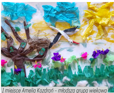
1 miejsce Amelia Kozdroń - młodsza grupa wiekowa