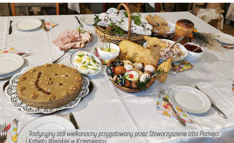
Tradycyjny stół wielkanocny przygotowany przez Stowarzyszenie Izba Pamięci Kobiety Wiejskiej w Krzemienicy