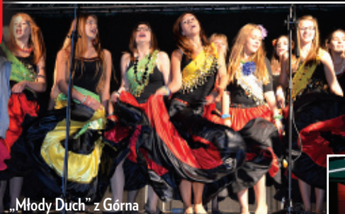
„Młody Duch” z Górna