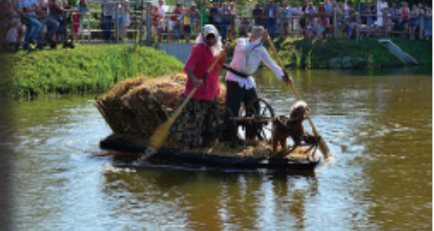
„Furmanka” - zdobywca I miejsca w konkursie „Pływanie na byle czym”