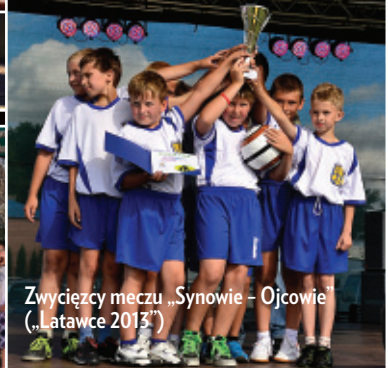
Zwycięcy meczu „Synowie - Ojcowie” („Latawce 2013”)