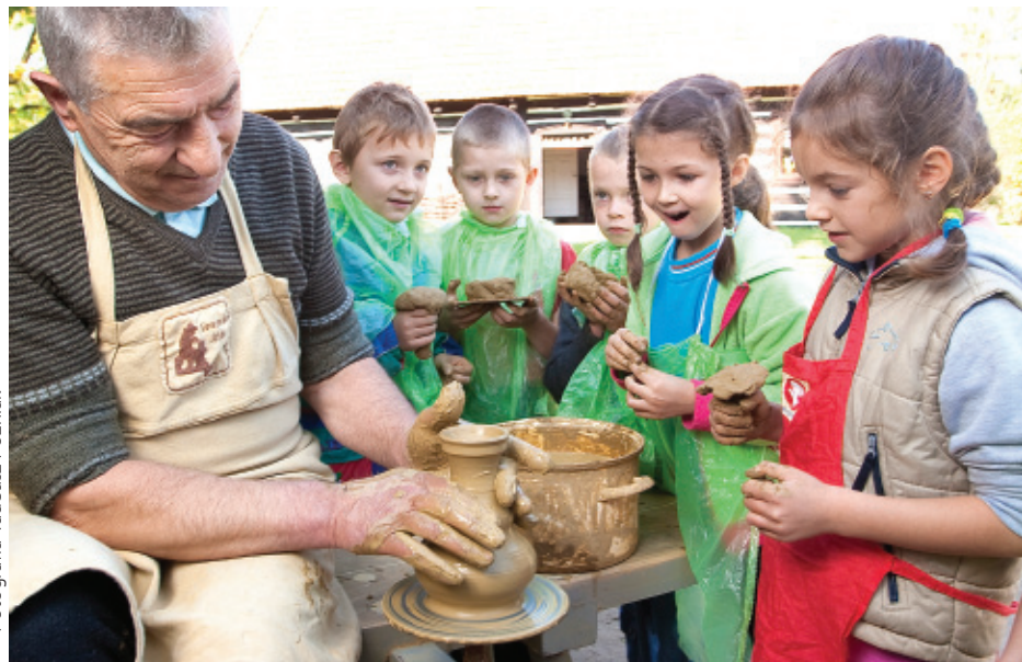
Fotografia Tadeusz Poźniak