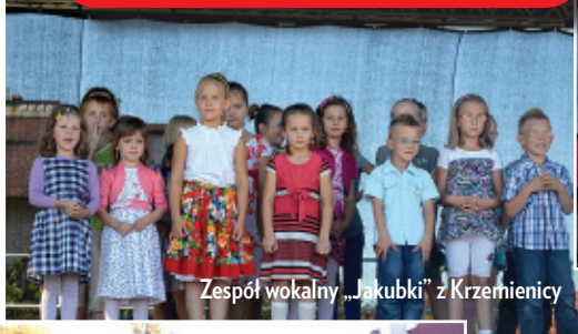
Zespół wokalny „Jakubki” z Krzemienicy