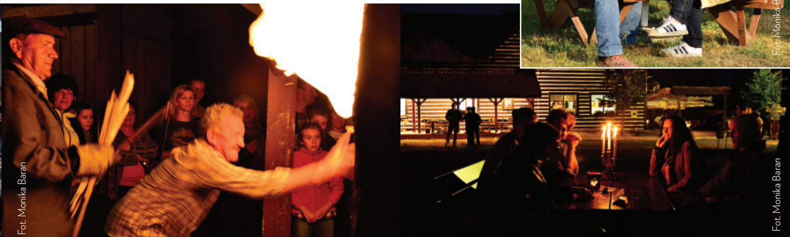
Fot. Monika Baran