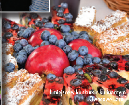
I miejsce w konkursie kulinarnym „Owocowe Lato”