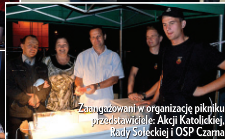
Zaangażowani w organizację pikniku przedstawiciele: Akcji Katolickiej, Rady Sołeckiej i OSP Czarna