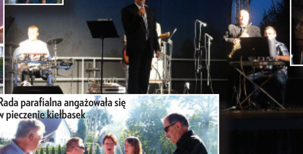
Rada parafialna angażowała się w pieczenie kielbasek