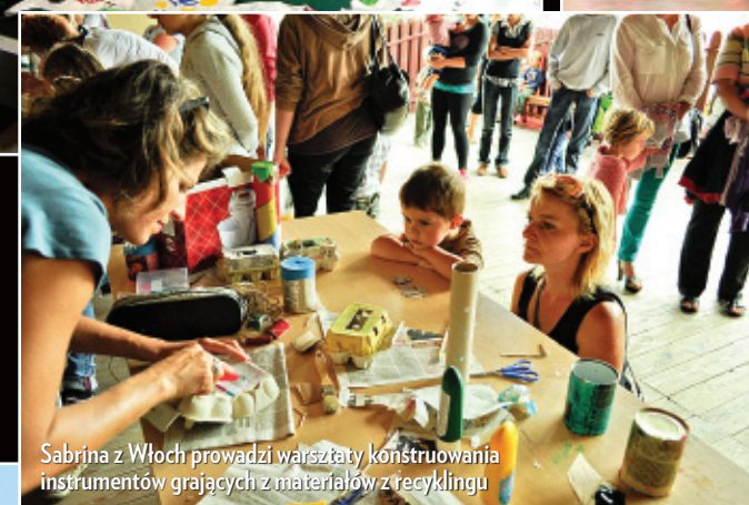
Sabrina z Włoch prowadzi warsztaty konstruowania instrumentów grających z materiałów z recyklingu