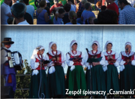
Zespół śpiewaczy „Czarnianki”