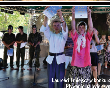
Laureaci I miejsca w konkursie „Pływanie na byle czym”