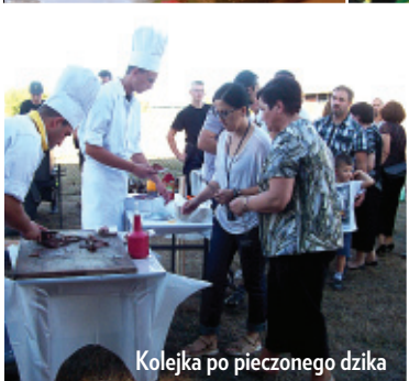
Kolejka po pieczonego dzika