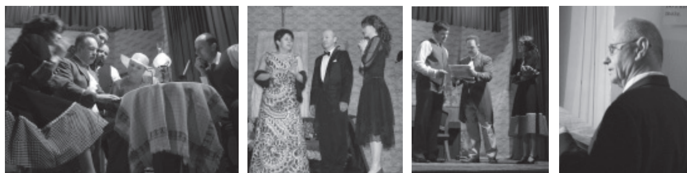
Zdjęcia z komedii Michała Bałuckiego pt. „Dom otwarty”. OK w Krzemienicy.

Zespół Teatru Dramatycznego w Krzemienicy przez trzy wieczory – 5, 6 oraz 13 lutego 2011 Teatr Dramatyczny w Krzemienicy bawił licznie zgromadzoną publiczność kolejną sztuką tym razem komedią Michała Bałuckiego pt. „Dom otwarty” w reżyserii Zygmunta Kluza. Sztuka ta przyciągnęła rekordową ilość widzów. Ponownie została też wystawiona, grana w roku ubiegłym, sztuka pasyjna „Za co go skazali”. Teatr wystawił ją trzykrotnie – w Krzemienicy, Markowej i Mrowli.