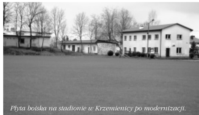
Płyta boiska na stadionie w Krzemienicy po modernizacji.

towym. Na parterze znajdować się będzie część socjalna dla zawodników i uczestników rozgrywek sportowych, a poddasze zostanie przeznaczone do celów gospodarczych. Z nowo wybudowanego budynku korzystać będą grupy sportowców użytkujących teren boiska. Przedsięwzięcie realizowane jest w ramach działania 3.4 „Odnowa i rozwój wsi” objętego Programem Rozwoju Obszarów Wiejskich na lata 2007-2013. W kwietniu 2011 roku Wójt Gminy przy kontrasygnacie Skarbnika Gminy podpisał umo-