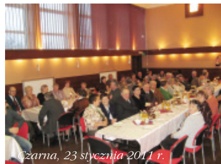
Czarńca, 23 stycznia 2011 r.