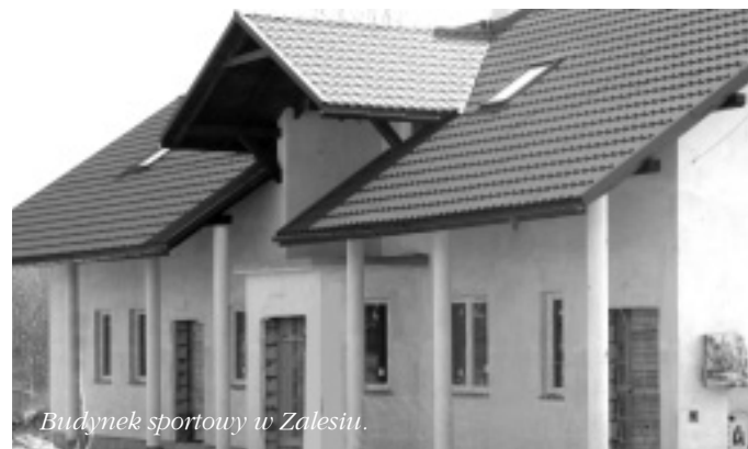
Budynek sportowy w Zalesiu.

Trwają także prace związane z budową bazy sportowo- rekreacyjnej w Zalesiu . Projekt zakłada budowę budynku- zaplecza sportowego wraz z infrastrukturą techniczną przy boisku spor-