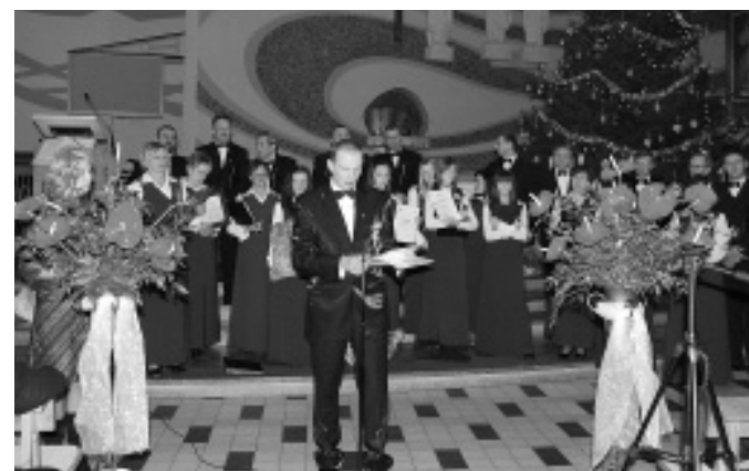
Zenon Buk Ośrodek Kultury w Krzemienicy