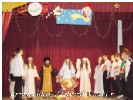
Krzemienica, 22 stycznia 2011 r.