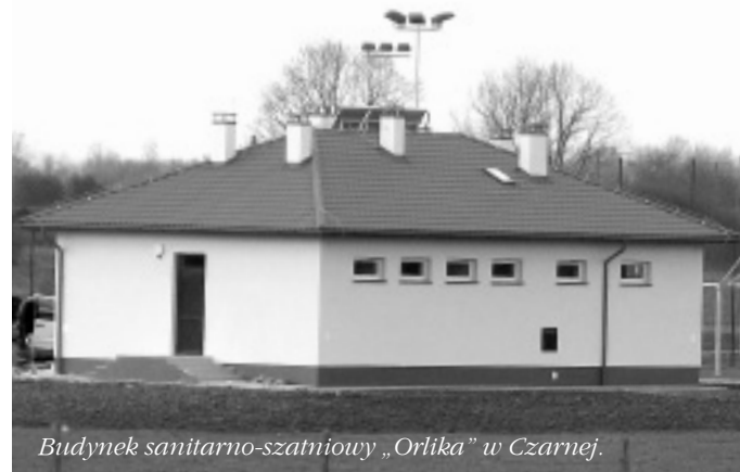
Budynek sanitarno-szatniowy „Orlika” w Czarnej.

Zupełnie nową inwestycją w gminie Czarna będzie kompleks sportowo- rekreacyjny wybudowany w ramach ogólnopolskiego projektu rządowego „ Moje boisko – Orlik 2012 ”, położony w centrum gminy, w miejscowości Czarna niedaleko Urzędu