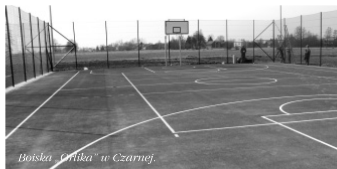
Boiska „Orlika” w Czarnej.