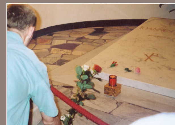
Maj 2005 r. Przedstawiciel chóru św. Jakuba składa kwiaty na grobie Ojca Świętego Jana Pawła II.