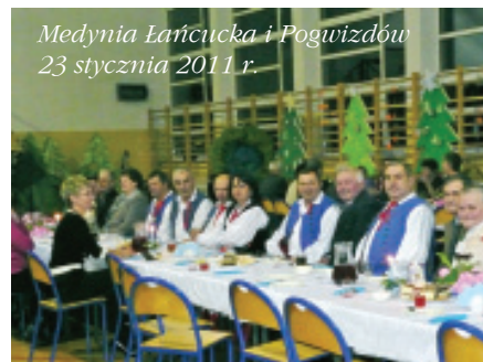
Medynia Łańcucka i Pogwizdów, 23 stycznia 2011 r.