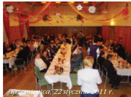
Krzemienica, 22 stycznia 2011 r.

Pierwsze miesiące nowego roku – styczeń i luty – to tradycyjnie czas spotkań opłatkowych z okazji przypadającego wtedy Dnia Babci i Dziadka. Chwila rozmowy, możliwość złożenia sobie życzeń na pomyślność w Nowym Roku, występy artystyczne najmłodszych, czasem wspólna zabawa – wszystko to sprawia, że spotkania takie cieszą się z roku na rok coraz większym zainteresowaniem seniorów. W przygotowanie takich spotkań włącza się wiele organizacji m.in. jednostki OSP, Gminny Ośrodek Pomocy Społecznej, Gminny Ośrodek Kultury, oddziały Akcji Katolickiej, Koła Gospodyń Wiejskich i stowarzyszenia. Wspólne chwile zawsze dają wszystkim wiele radości, zarówno uczestnikom jak i organizatorom.