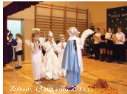
Zalesie, 13 stycznia 2011 r.