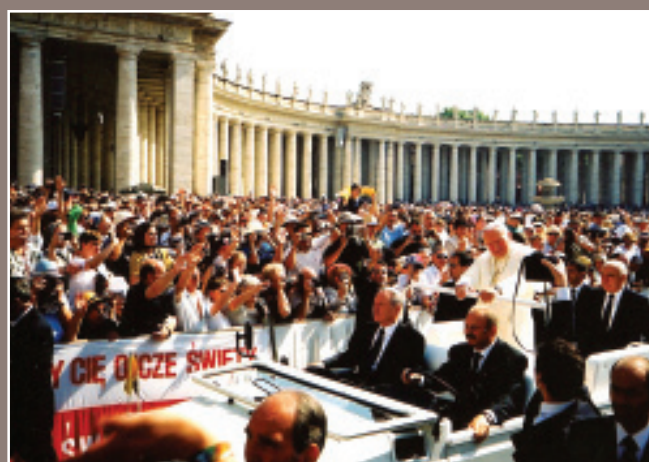
Lipiec 2000 r. Plac św. Piotra w Rzymie. Pielgrzymka parafian z Czarniej.