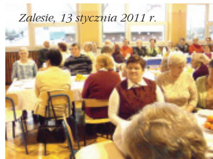
Zalesie, 13 stycznia 2011 r.