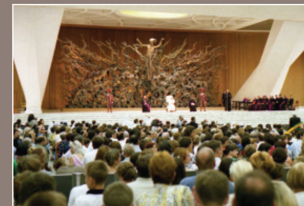
Lipiec 1999. Pielgrzymka pracowników ZS im. Jana Pawła II w Medyni Głogowskiej. Audycja generalna.