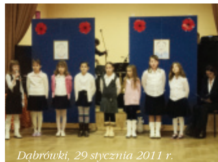
Dąbrówki, 29 stycznia 2011 r.