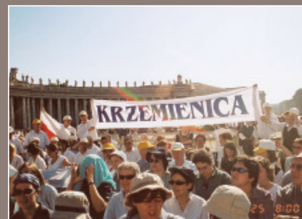
Maj 2005 r. Pielgrzymka do Rzymu. Chór św. Jakuba z Krzemienicy.