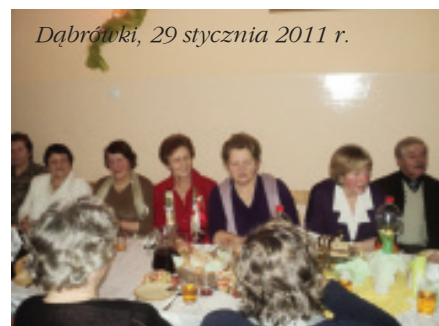
Dąbrówki, 29 stycznia 2011 r.