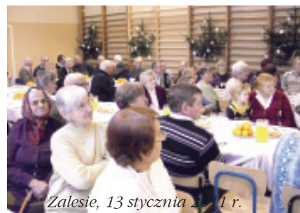
Zalesie, 13 stycznia 2011 r.