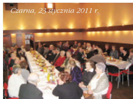
Czarńca, 23 stycznia 2011 r.