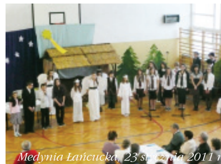
Medynia Łańcucka, 23 stycznia 2011 r.