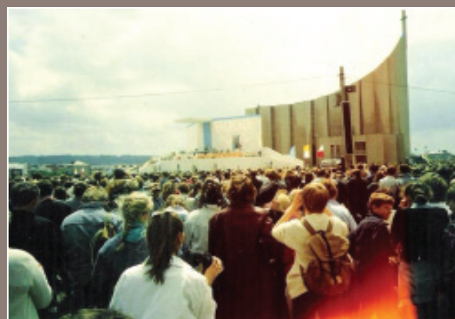
2 czerwca 1991 r. Papieska msza św. na rzeszowskich błoniach.