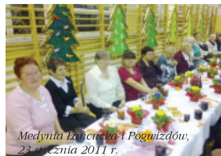
Medynia Łańcucka i Pogwizdów, 23 stycznia 2011 r.