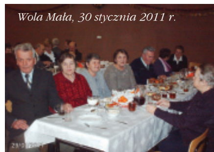
Wola Mała, 30 stycznia 2011 r.