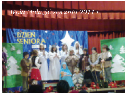
Wola Mała, 30 stycznia 2011 r.