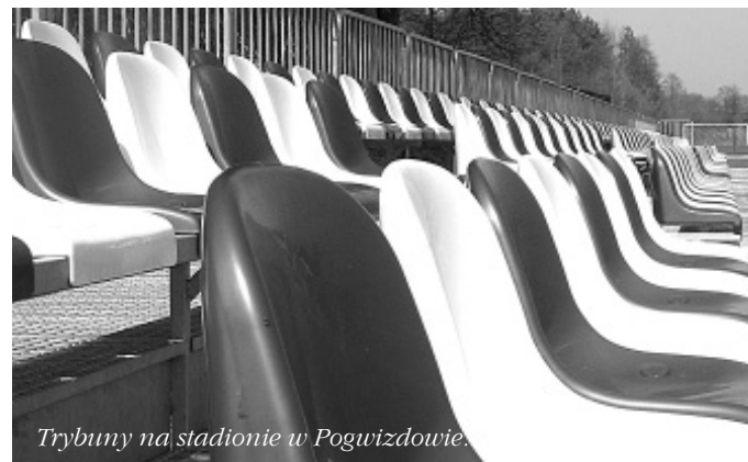
Trybuny na stadionie w Pogwizdowie.

Referat Promocji I Pozyskiwania Funduszy